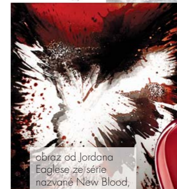
obraz od Jordana Eaglese ze série nazvané New Blood, VLEVO: parfém Hypnotic Poison, Dior