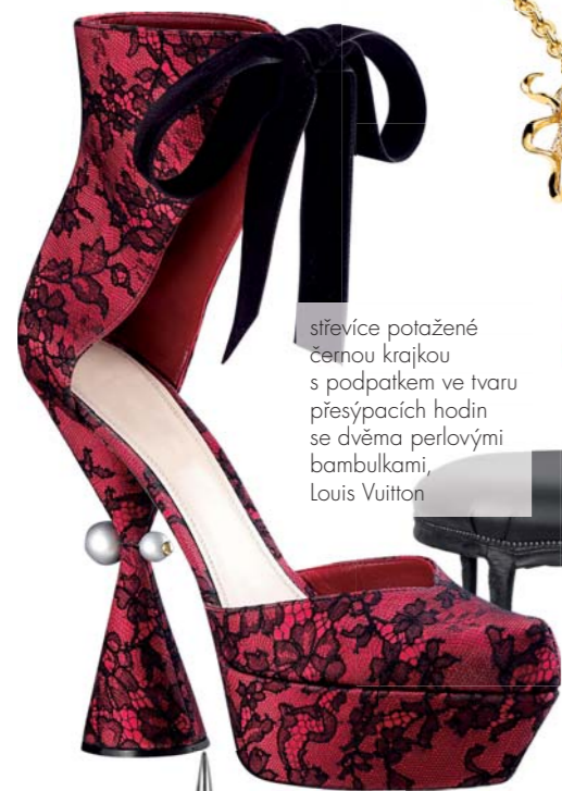
sřevíce potažené černou krajkou s podpatkem ve tvaru přesýpacích hodin se dvěma perlovými bambulkami, Louis Vuitton