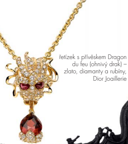
řetízek s přívěskem Dragon du feu (ohnivý drak) – zlato, diamanty a rubíny, Dior Joaillerie