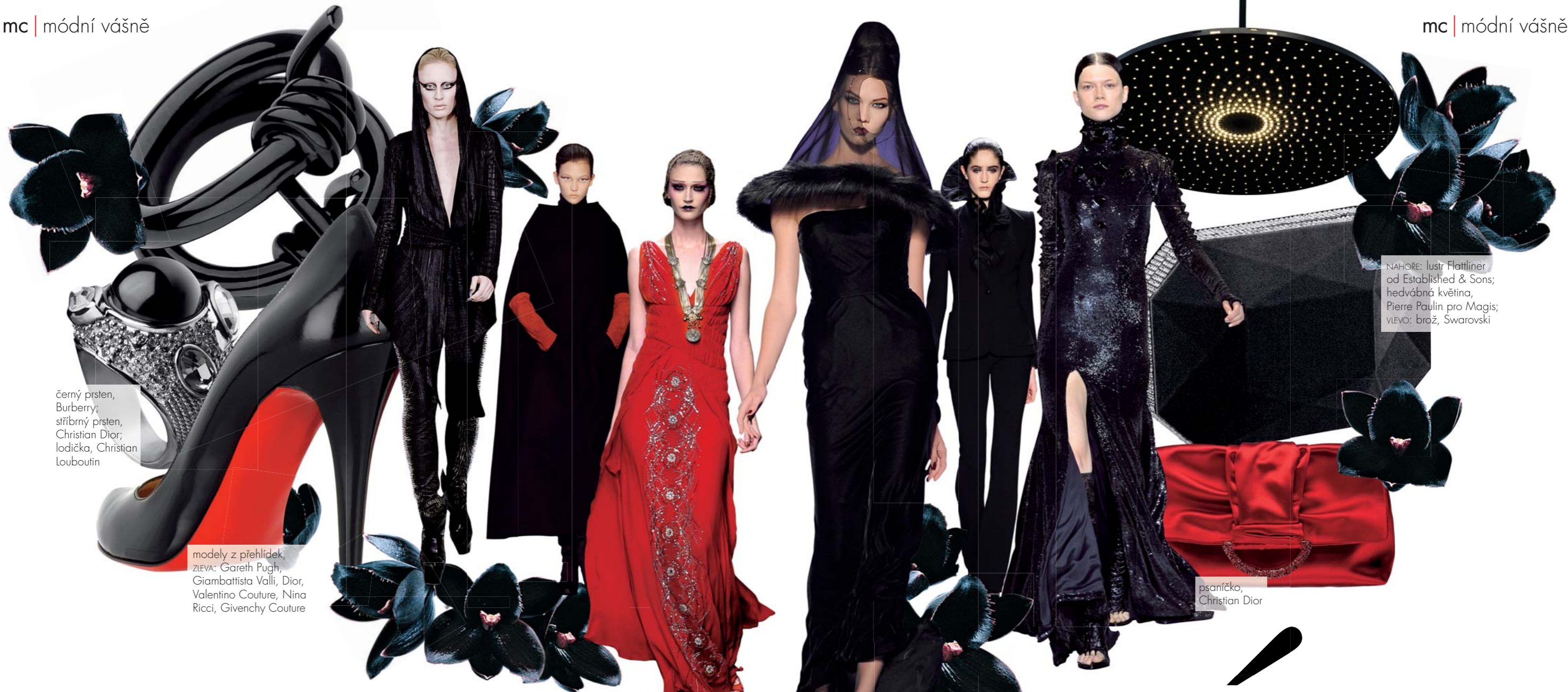
černý prsten, Burberry; stříbrný prsten, Christian Dior; lodička, Christian Louboutin