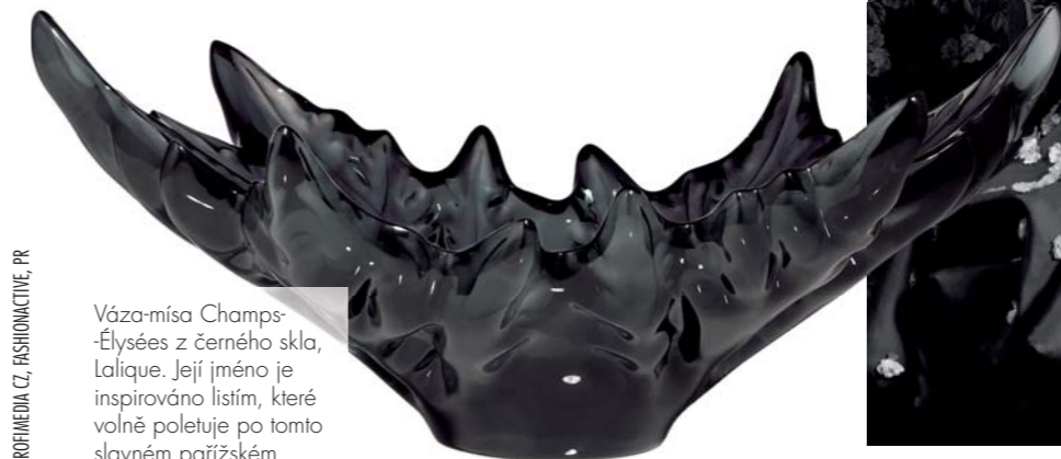
Váza-mísa Champs-Élysées z černého skla, Lalique. Její jméno je inspirováno listím, které volně poletuje po tomto slavném pařížském bulváru.