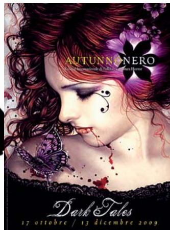
modely z přehlídek, shora: Chanel, Gucci, Balmain; VLEVO: plakát k italskému festivalu Autunno Nero věnovanému „černým pohádkám“ neboli hrůzostrašným a děsivým báchorkám. Více informací na www.autunnoero.com