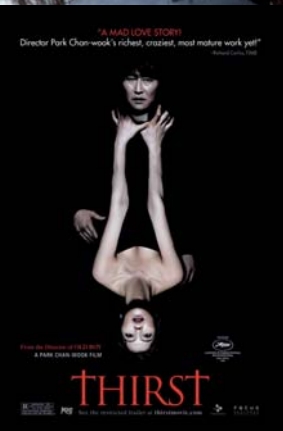
NAHOŘE: Kirsten Stewart a Robert Pattinson ve slavné upířské sérii Stmívání ; plakát k filmu Bakjwi režiséra Parka Chan-wooka, v němž se kněz změní v upíra.