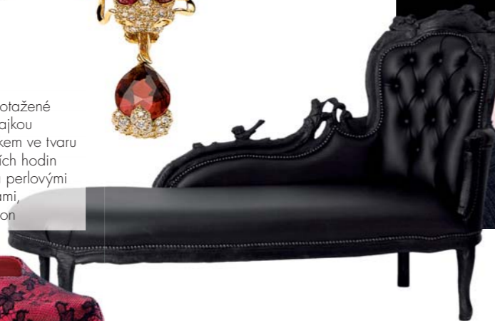
sněhově bílý obličej, výrazné oči a rty: make-up Prada pro přehlídku podzim/zima 2009–10. VLEVO: sofa, Gaas & den Herder

C HODIT S UPÍREM VLASTNĚ MŮŽE BÝT DOCELA VÝHODNÉ. Je nadpozemsky krásný, tajemný, melancholický a nikdy od něj neuslyšíte jediný přihlouplý vtip. Pokud by vás kouzl v nějakém rozumném věku (řekněme v pětadvaceti), ušetříte spoustu peněz za botox a liposukce, protože se také stane upírkou a vaše podoba zůstane nezměněná na další tisíce let. Sice prospíte celý den, ale alespoň máte jistotu, že vás v noci nikdo nevykrade. A protože není klasická lidská jídla, ušetříte v restauracích a supermarketech. Navíc, pokud platí teorie, že ženy chtějí „zlé hochy“, v upírech je našly. Vždyť přece mají hroživou pověst, jsou nebezpeční a zároveň zranitelní, protože žijí na okraji společnosti. Harry Medved z portálu fandango.com (největší internetový prodejce lístků do kin a divadel) to zase chápe takto: upíři jsou tak sexy proto, že „mají silnou a zoufalou potřebu žít v sousedství lidí, kteří jsou jimi fascinováni. Je to vzrušující, protože nikdy nevíte, kdy nad sebou upír ztratí kontrolu a kousne vás“. V souvislosti s tím, jak muži přestávají býti muži, protože večer se nechutně rozvalí na gauči a místo do tepny se zakousnou leda tak do bagety, se také najde stále více žen, které prostě touží po starém dobrém drsnákově. A můžete se jim divit?