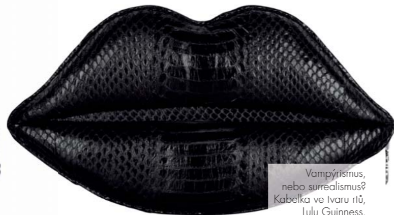
Vampýrismus, nebo surrealismus? Kabelka ve tvaru rtů, Lulu Guinness.

C HODIT S UPÍREM VLASTNĚ MŮŽE BÝT DOCELA VÝHODNÉ. Je nadpozemsky krásný, tajemný, melancholický a nikdy od něj neuslyšíte jediný přihlouplý vtip. Pokud by vás kouzl v nějakém rozumném věku (řekněme v pětadvaceti), ušetříte spoustu peněz za botox a liposukce, protože se také stane upírkou a vaše podoba zůstane nezměněná na další tisíce let. Sice prospíte celý den, ale alespoň máte jistotu, že vás v noci nikdo nevykrade. A protože není klasická lidská jídla, ušetříte v restauracích a supermarketech. Navíc, pokud platí teorie, že ženy chtějí „zlé hochy“, v upírech je našly. Vždyť přece mají hroživou pověst, jsou nebezpeční a zároveň zranitelní, protože žijí na okraji společnosti. Harry Medved z portálu fandango.com (největší internetový prodejce lístků do kin a divadel) to zase chápe takto: upíři jsou tak sexy proto, že „mají silnou a zoufalou potřebu žít v sousedství lidí, kteří jsou jimi fascinováni. Je to vzrušující, protože nikdy nevíte, kdy nad sebou upír ztratí kontrolu a kousne vás“. V souvislosti s tím, jak muži přestávají býti muži, protože večer se nechutně rozvalí na gauči a místo do tepny se zakousnou leda tak do bagety, se také najde stále více žen, které prostě touží po starém dobrém drsnákově. A můžete se jim divit?