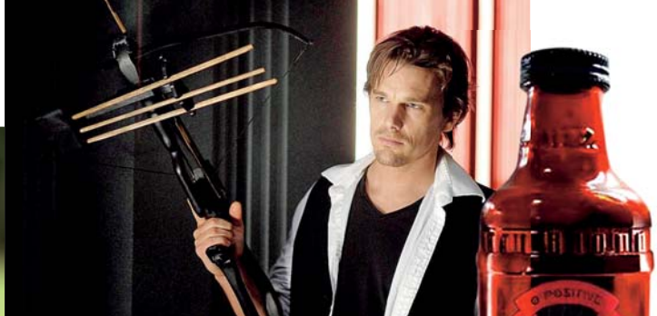
Ethan Hawke, napůl člověk, napůl upír ve filmu Světání (v kinech od dubna). Vedle lahev umělé krve s příchutí pomeranče (to je, co?), nápoj, který dal název americkému televiznímu seriálu Pravá krev ( True Blood ).