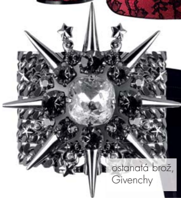
ostanatá brož, Givenchy