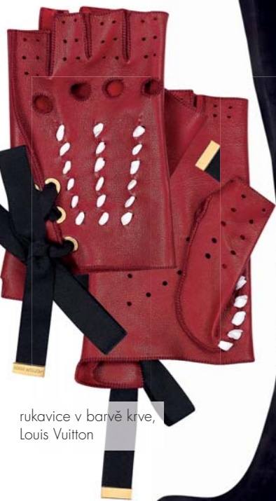
rukavice v barvě krve, Louis Vuitton